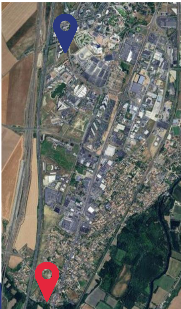
Site de Grand Pont