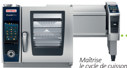
Maîtrise le cycle de cuisson

Concrètement, l'objectif est de simplifier la mise en place de la traçabilité pour l'opérateur, limiter le nombre de saisies, de manipulations et coordonner les différents systèmes d'enregistrements.