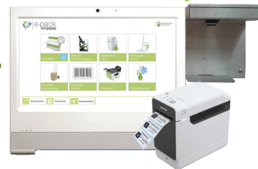
Centralise instantanément toutes ces données